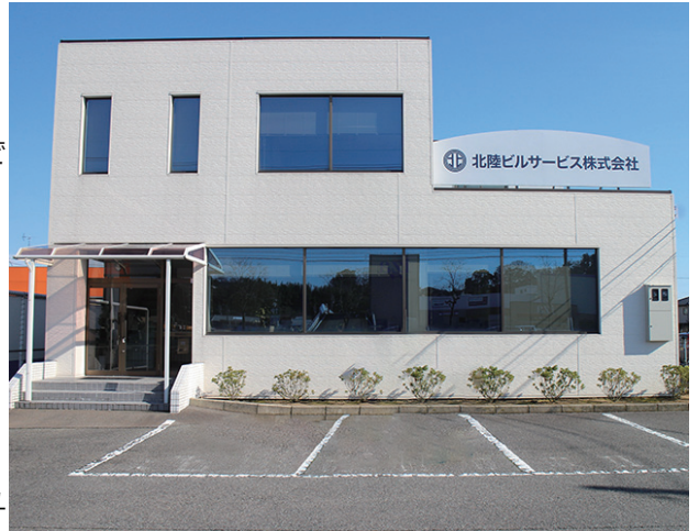
北陸ビルサービス株式会社

A: 二人とも本当に頻りに良い情報を提供して下さいますし、困っていることはすぐに対応してくれるので助かっています。わからないことがあって質問しても、的確に答えて下さるのでコミュニケーションも良好で、ありがたい存在です。